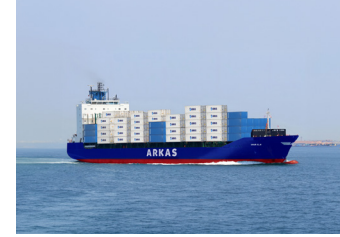
ONUR G. | 1.440 TEU 08 Kasım 2023