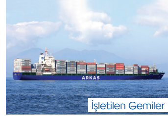
SINE | 2.824 TEU 16 Mart 2015