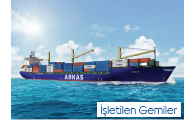
CINZIA | 2.452 TEU 26 Nisan 2016