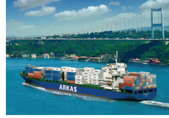
STANLEY | 2.824 TEU 7 Temmuz 2015