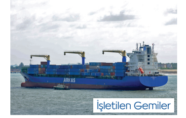
GÜLBENİZ | 2.478 TEU 18 Nisan 2011