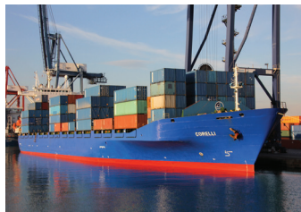
CORELLI | 1.445 TEU 27 Ekim 2009