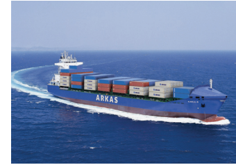
KARLA | 1.221 TEU 23 Temmuz 2004