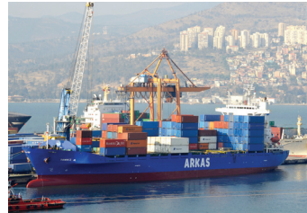
TOMRİZ | 1.445 TEU 25 Haziran 2007