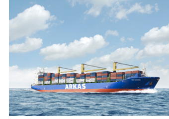
FUNDA | 2.586 TEU 12 Ocak 2017