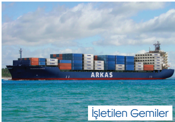
GISELE | 2.702 TEU 12 Haziran 2015