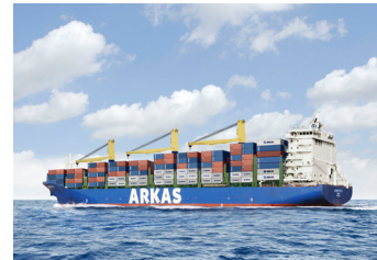
AURETTE | 2.586 TEU 8 Haziran 2017