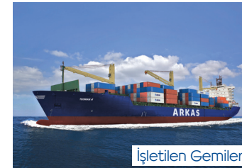
TEOMAN | 2.452 TEU 3 Mayıs 2016