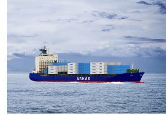
DENIS | 1.440 TEU 30 Ekim 2023