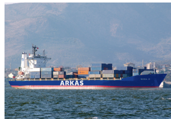
ROZA | 1.445 TEU 20 Haziran 2007