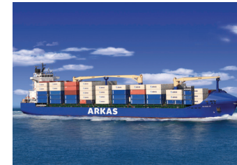
DIANE | 1.604 TEU 29 Aralık 2008