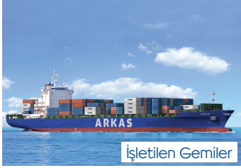
SASKIA | 2.824 TEU 3 Haziran 2015