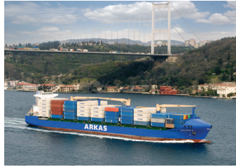
CLAIRE | 1.604 TEU 6 Kasım 2008