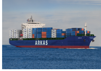
EMMA | 2.837 TEU 8 Eylül 2014