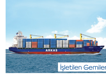
MARTHA | 2.474 TEU 10 Mart 2015