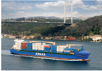
JEAN PIERRE | 1.604 TEU 14 Aralık 2007