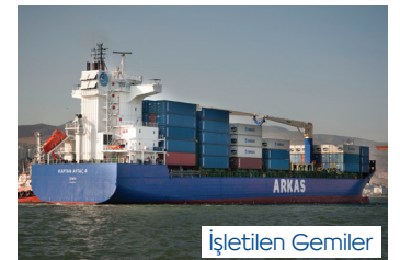
LUCIEN G. | 1.199 TEU 9 Ağustos 2002