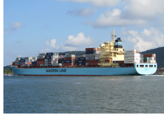
MAERSK JAIPUR | 2.824 TEU 22 Mayıs 2017