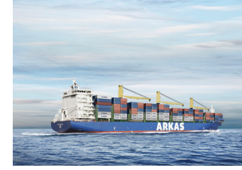
LUCIEN | 2.586 TEU 5 Nisan 2017