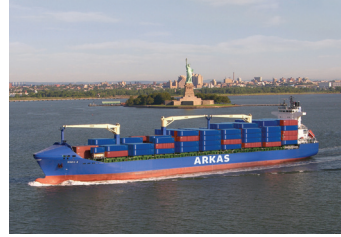
MARIO | 1.604 TEU 11 Temmuz 2007