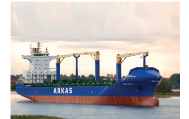
BERNARD | 1.604 TEU 22 Ekim 2009