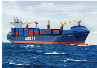
HILDE | 1.529 TEU 13 Temmuz 2005