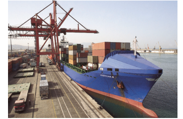
YİĞİTCAN | 1.208 TEU 26 Ekim 2001