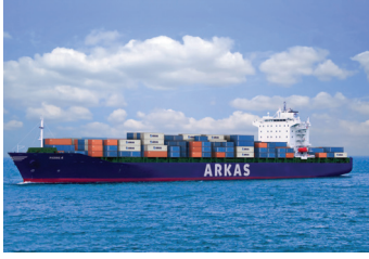
PIERRE | 2.837 TEU 14 Mayıs 2015