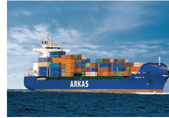
GABRIEL | 1.221 TEU 17 Eylül 2004