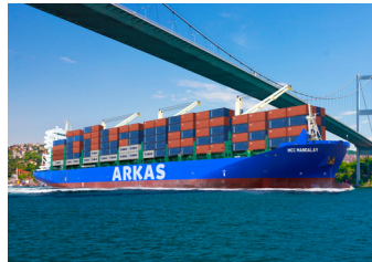
ANDREA | 2.586 TEU 19 Temmuz 2017