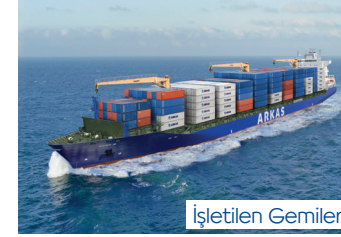
VIVIEN | 2.478 TEU 7 Mayıs 2010